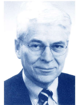
Volkmar Strauch, Staatssekretär für Wirtschaft des Landes Berlin

Die vollständigen Interviews und Zusatzinformationen können Sie in der online-Kundeninformation im Internet nachlesen.